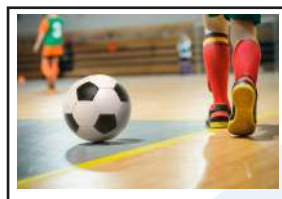
Escolinha de Futebol